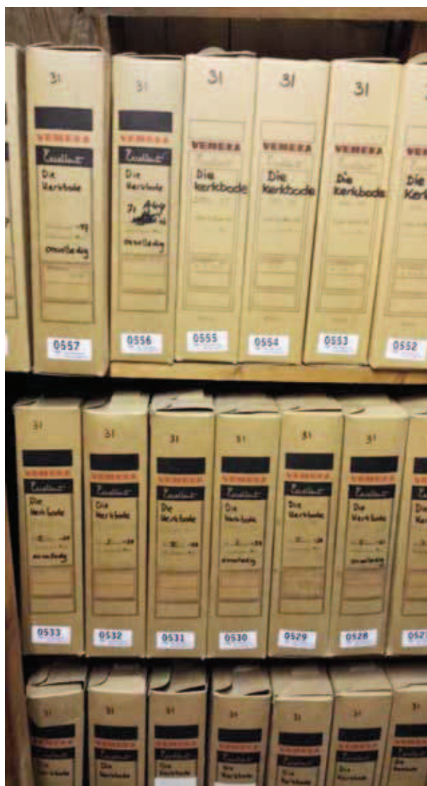
Klaar voor de verhuizing.

De persoonlijke archievencollecties geven vergelijkbare inkijkjes. Het persoonlijk archief van H. Emous, een schoolhoofd uit Amsterdam dat actief onderwijzers wierf, bevat veel brieven van Nederlandse onderwijzers die met name in de jaren 90 van de negentiende eeuw naar Zuid-Afrika vertrokken. Deze onderwijzers vertellen zeer uitgebreid over het opzetten van scholen in een klimaat dat niet altijd vriendelijk is (de beruchte